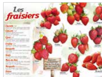
• LES FRAISIERS

Les CHOUX (Choux : Brocoli, Cabus pointu, Cabus Tête de Pierre, de Bruxelles, de Milan, rouge / Chou-fleur, Chou-fleur Romanesco)