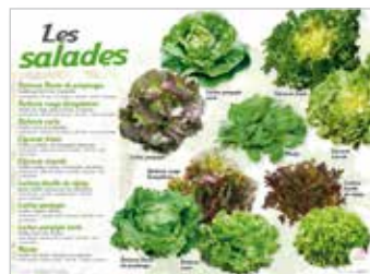
• LES SALADES