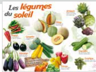
• LES LÉGUMES DU SOLEIL (POIVRONS, MELONS,...)