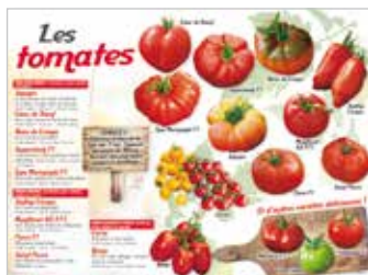
• LES TOMATES