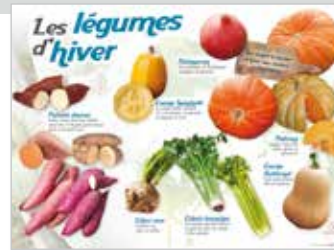
• LES LÉGUMES D'HIVER (POTIRONS, PATATES DOUCES,...)